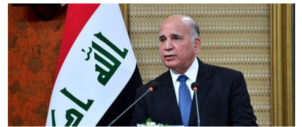
امیدوارم گفت‌وگویی بین ایران و عربستان وارد مرحله دیپلماتیک شود

سخنگوی وزارت خارجه چین رویکرد مسئولانه شورای امنیت سازمان ملل در قبال مسئله اوکراین را خواستار شد. به گزارش اسپوتنیک، سخنگوی وزارت خارجه چین خواستار اقدامات سازنده شورای امنیت سازمان ملل در قبال حل و فصل بحران در اوکراین شد. «وانگ یون بین» اعلام کرد که چین از شورای امنیت سازمان ملل می‌خواهد تا اقدامات سازنده و مسئولانه‌ای را در جهت ایجاد شرایط و فضای مناسب برای حل و فصل سیاسی بحران اوکراین صورت دهد. در حالیکه شورای امنیت نشست اضطراری را با موضوع الحاق جمهوری‌های دونباس به روسیه برگزار می‌کند، وی گفت که شورای امنیت سازمان ملل متحد به عنوان هسته اصلی سازوکار امنیت جمعی بین‌المللی، باید از ابزار میانجی‌گری و سازش بهره کامل را ببرد و نیز مسیر درستی را در میزگرد جهت نیل به صلح دنبال کند.