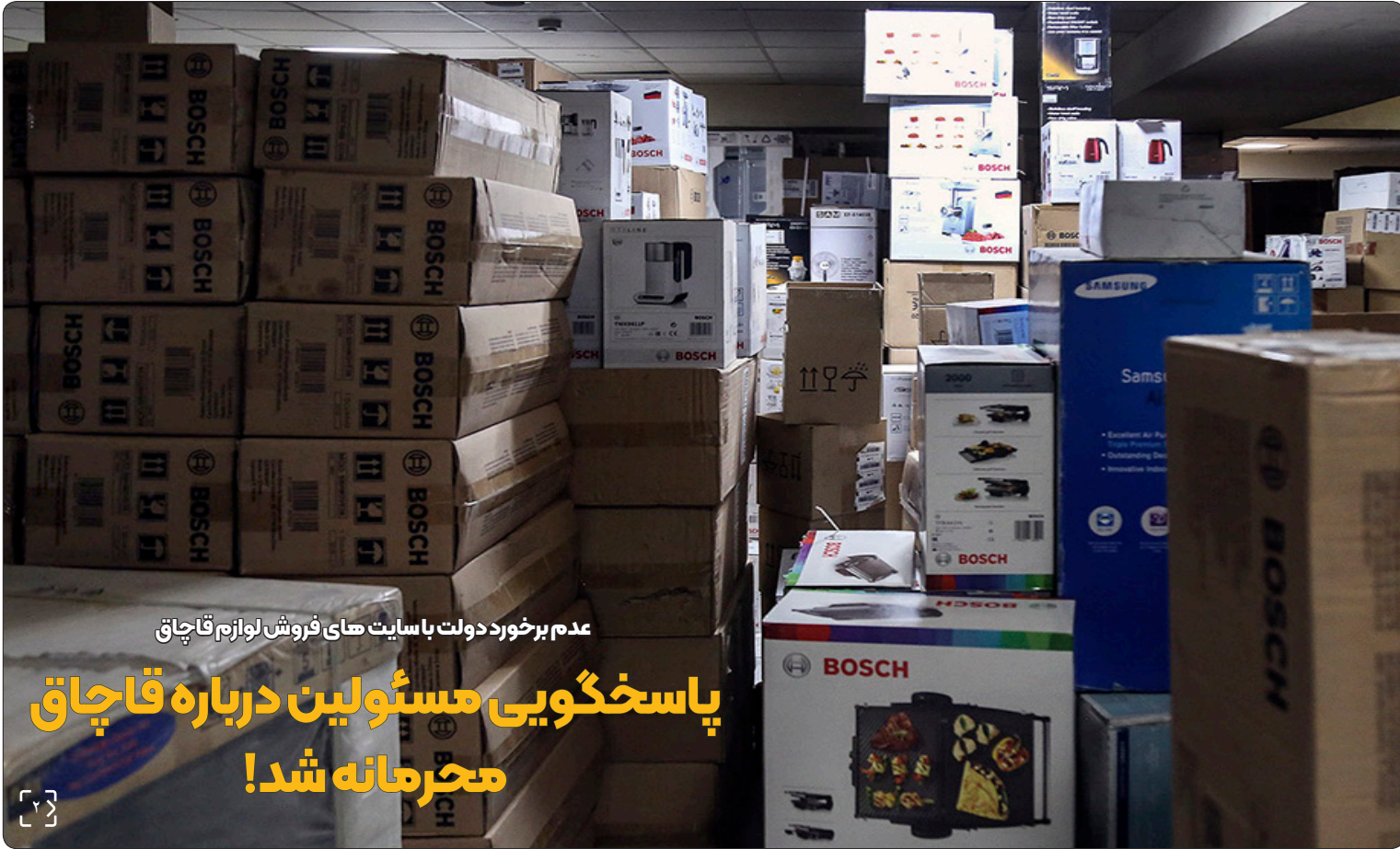
عدم برخورد دولت با سایت‌های فروش لوازم قاچاق