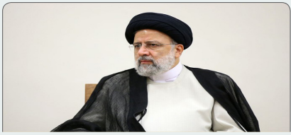
قدرت جمهوری اسلامی ایران برگرفته از خون شهدایی همچون شهید سلیمانی است