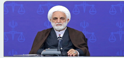
هشدار رئیس قوه قضائیه به باز یگران و آتش بیاران معرکه اغتشاشات