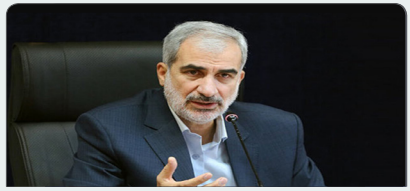
مشکل کمبود معلم به روش‌های مختلف حل شد