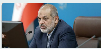
وزیر کشور: تردد زائران در مرزهای کشور عادی است