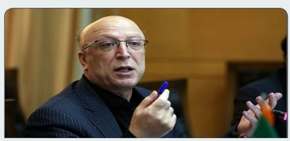
ضرایب امتحانی رشته‌های مختلف کنکور مصوب شد