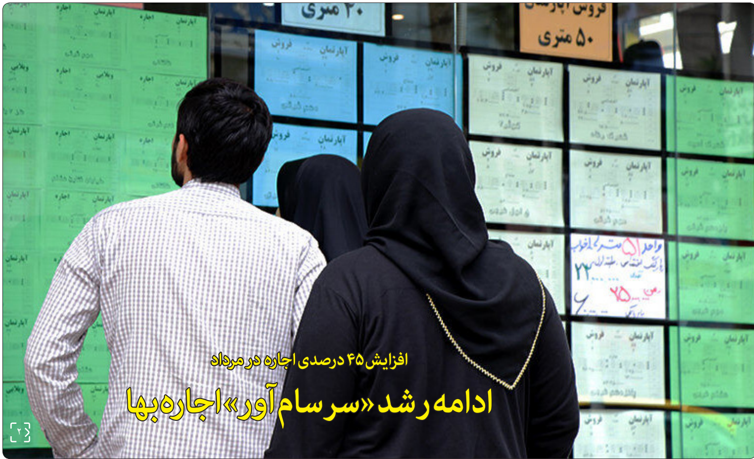
افزایش ۴۵ درصدی اجاره در مرداد ادامه رشد «سر سام آور» اجاره‌بها

مدیرعامل شرکت ملی پالایش و پخش فرآورده‌های نفتی: