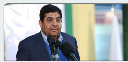
دولت بابت سرمایه‌گذاری ارزی به اتباع همسایه مشوق می‌دهد