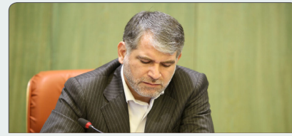
وزیر جهاد کشاورزی: افزایش تولید گندم به ۱۱ میلیون تن