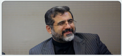
تاکید وزیر ارشاد بر تقویت تعاملات بین‌المللی با محوریت ابن سینا