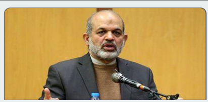
صدر کارت شناسایی موقت برای افراد فاقد شناسنامه