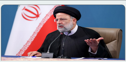
تقویت نقش بخش تعاونی در اقتصاد کشور باور جدی دولت مردمی است