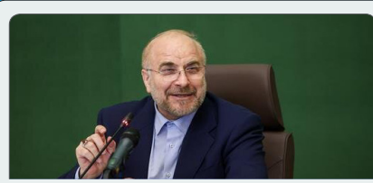
مجلس برای تحول در قوانین اقتصادی کشور با دولت همکاری می‌کند