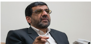
وزیر میراث فرهنگی: