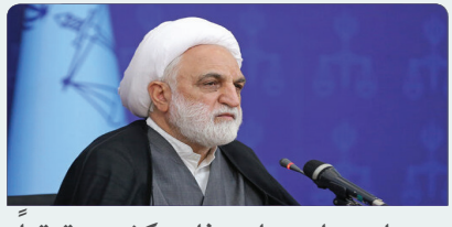
دستاوردهای صنایع دفاعی کشور حقیقتاً شگرف و قابل اعتنا است