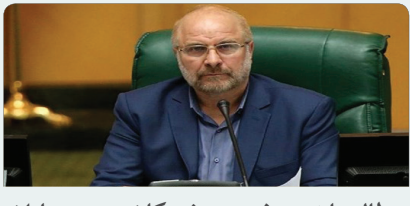
مطالبات صنفی پزشکان و دستیاران تخصصی پرداخت شود