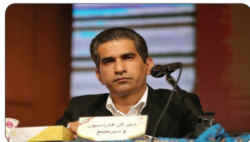
دبیرکل فدراسیون فوتبال: