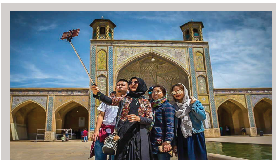
۷ اقدام شاخص دولت سیزدهم در بخش گردشگری

آنچه در ذات گردشگری نهفته است تقویت روحیه شادی در جامعه است، وزارت میراث فرهنگی در یک سال گذشته تلاش اجتماعی با احویای جاذبه‌های مکمل مانند موسیقی و نمایش را مورد توجه قرار داد. برگزاری کنسرت سالار عقیلی در ارگ تاریخی یم (بازدید ۲۵ هزار نفر) و اجرای کنسرت-نمایش سیمد در مجموعه فرهنگی تاریخی سعدآباد (با حداقل ۳ هزار تماشاچی در هر شب) نمونه‌های روشن از این رویدادها و میزان استقبال مردم و گردشگران است. برگزاری نمایشگاه بین‌المللی گردشگری و صنایع دستی