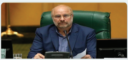
نظارت بر ساخت و سازها جنبه صوری پیدا کرده است