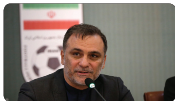
سرپرست فدراسیون فوتبال: