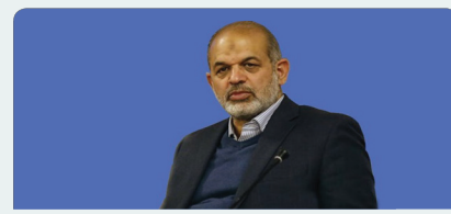
همه گروه‌ها موضع خود را با جریان فتنه مشخص کنند