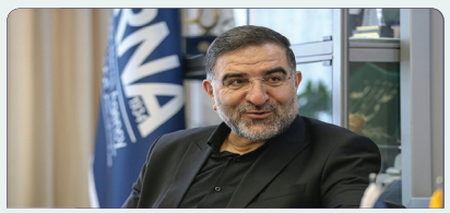
گرفتن تضمین و اخذ تعهد از طرف‌های مقابل مورد انتظار مردم و نظام است