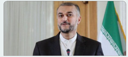
آمریکار مذاکرات انعطاف نشان ندهد، "پلن B" داریم