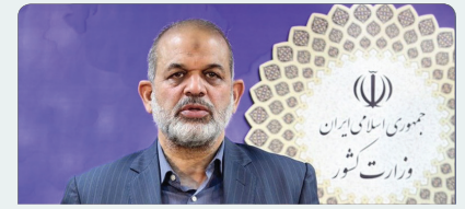
امنیت در جمهوری اسلامی ایران مردم محور است