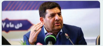
برای حل چالش‌ها باید بر ایده‌ها و سرمایه‌های مردمی تکیه کنیم

رئیس جمهور در نشست مشترک دولت، هیات رئیسه و روسای کمیسیون‌های تخصصی مجلس: