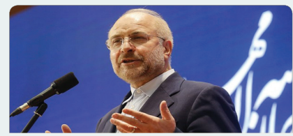
موضوع محیط زیست و دریاچه ارومیه بسیار حیاتی است