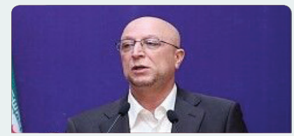
ایجاد فرهنگ سالم بزرگترین سرمایه جاودانه هر کشور است