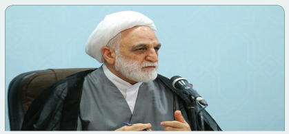
تاکید رئیس عدلیه بر شناسایی و ارزیابی خطر وقوع جرم