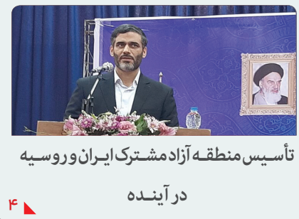
تأسیس منطقه آزاد مشترک ایران و روسیه در آینده