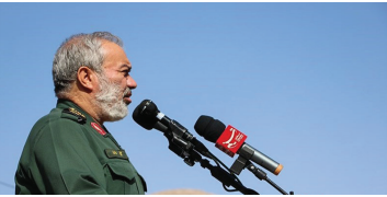
جانشین فرمانده کل سپاه :