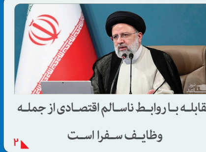
مقابله با روابط ناسالم اقتصادی از جمله وظایف سفرا است