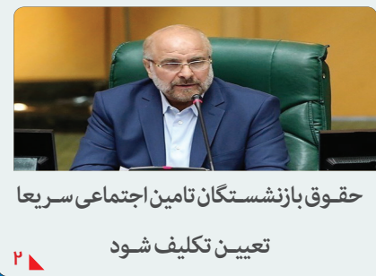
حقوق بازنشستگان تامین اجتماعی سرریعا تعیین تکلیف شود