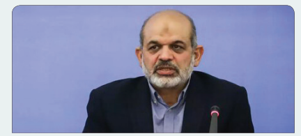
با هرگونه قصور در سیل استهبان برخورد می شود