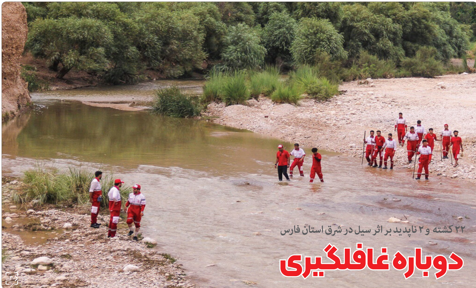
۲۲ کشته و ۲ ناپدید بر اثر سیل در شرق استان فارس دوباره غافلگیری

رئیس در دهمین اجلاس رایزنان فرهنگی ایران: