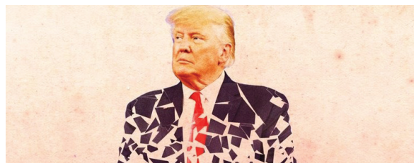
ضربه جدید به جایگاه ترامپ در حزب جمهوری خواه

مشاور امنیت ملی کاخ سفید اعلام کرد که «جو بایدن» رئیس جمهور ایالات متحده از بیم وقوع جنگ جهانی سوم تجهیزات نظامی خاص به اوکراین ارسال نمی کند. مشاور امنیت ملی کاخ سفید اعلام کرد که بنابر نظر «جو بایدن» رئیس جمهور ایالات متحده، آمریکا تجهیزات نظامی خاص به اوکراین ارسال نمی کند. به گزارش وبگاه «یاهو نیوز» «جیک سالیوان» مشاور امنیت ملی کاخ سفید گفت: «در میان این سلاح ها موشک های دوربرد " آتامکس " هستند که ۳۰۰ کیلومتر برد دارند. سالیوان اظهار داشت: «در حالی که هدف کلیدی ایالات متحده انجام هر کاری برای حمایت و حفاظت از اوکراین است، اما هدف مهم دیگر این است که اطمینان حاصل شود در شرایطی قرار نخواهیم گرفت که به جنگ جهانی سوم نزدیک شویم.»