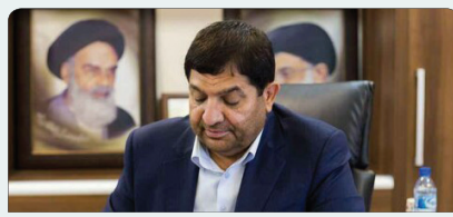
آیین نامه اجرایی اعطای تسهیلات ازدواج، اشتغال و حمایتی ابلاغ شد