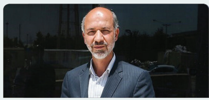
انتقال پساب بهداشتی تبریز و ارومیه به دریاچه عملیاتی می شود