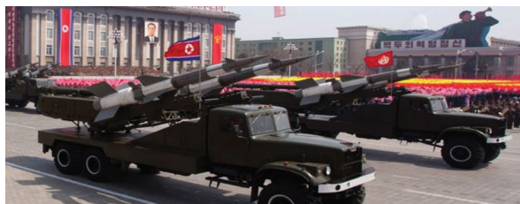
لایه های پدافندی کره شمالی؛ سده ارتقای نسل پنجم آمریکا

نشریه «دیپلمات» نوشت: سامانه های پدافند موشکی کره شمالی قادرند عملیات محتمل جنگنده های «اف-۳۵» آمریکا را با مشکل مواجه کنند. یک نشریه خارجی ویژه آسیای شرق و جنوب شرقی به تازگی به «نوان نظامی کره شمالی» در دفع حملات محتمل آمریکا به ویژه نیروی هوایی ایالات متحده اشاره کرد و نوشت: سامانه های پدافند موشکی کره شمالی قادرند عملیات جنگنده های نسل پنجم «اف-۳۵» آمریکا را با مشکلات بسیاری مواجه کنند. نشریه «دیپلمات» در بخش هایی از این مطلب در زمینه قدرت پدافندی و موشکی کره شمالی آمده است، ورود به خدمت سامانه پدافند موشکی «هیونگا-۵» در سال ۲۰۱۷ وضعیت پدافندی این کشور را تغییر داد و سرمایه پیشرفته و متحرک برای شکار اهداف هوایی در ارتفاع بالا را به طور گسترده در مقایسه با سامانه «اس-۳۰۰» روسی، البته با ابعاد کوچکتر ارائه داد.