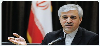
برگزاری رویدادهای ورزشی مشترک با کشورهای همسایه در دستور کار است