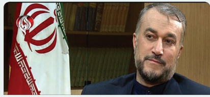
جمهوری اسلامی ایران مرکز دیپلماسی پو یا ست