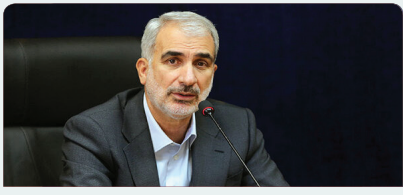
شیوه‌نامه رتبه‌بندی معلمان از همین هفته اجرایی شود