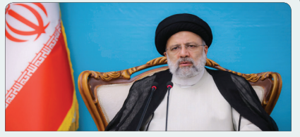
دستور رئیسی برای جلوگیری از واردات بی رویه