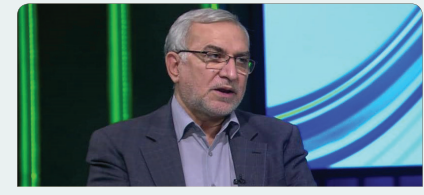
بنای ما این است که هر ایرانی با کد ملی خود بیمه شود